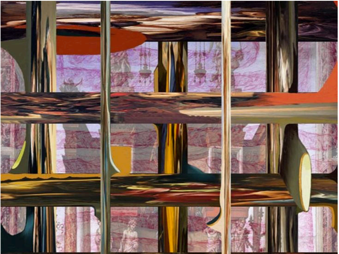
Michael Mogavero · Smoke Signal (detail) · digital painting / print

Prints and Drawings Room - 20. April bis 4. August 2019