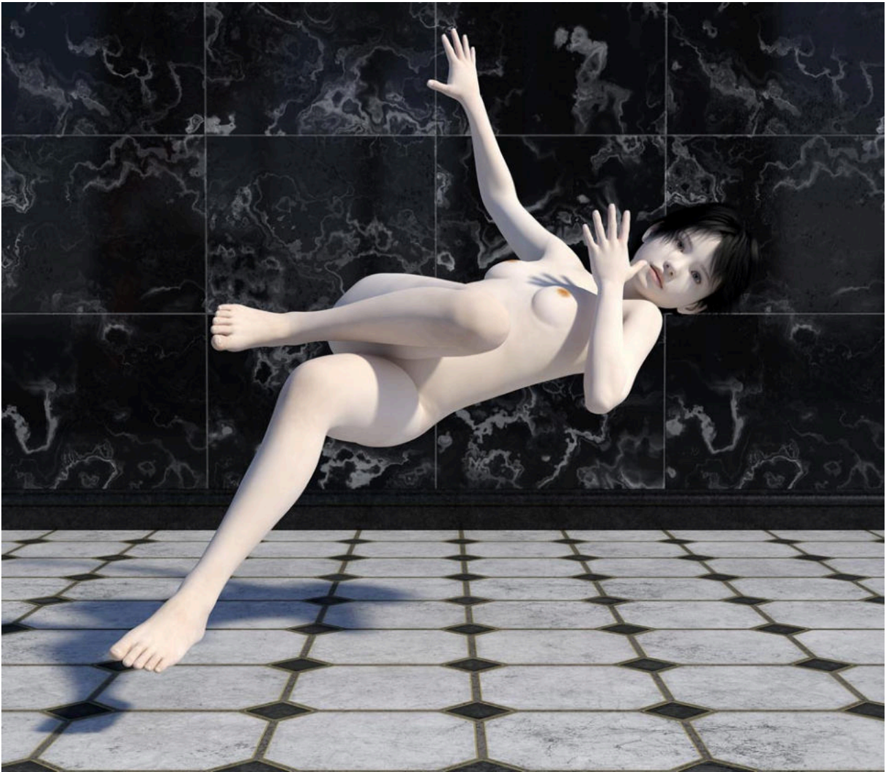
Gerhard Mantz · No place to Fall · 2019 · computer simulation

Spotlight Suite - 20. April bis 4. August 2019