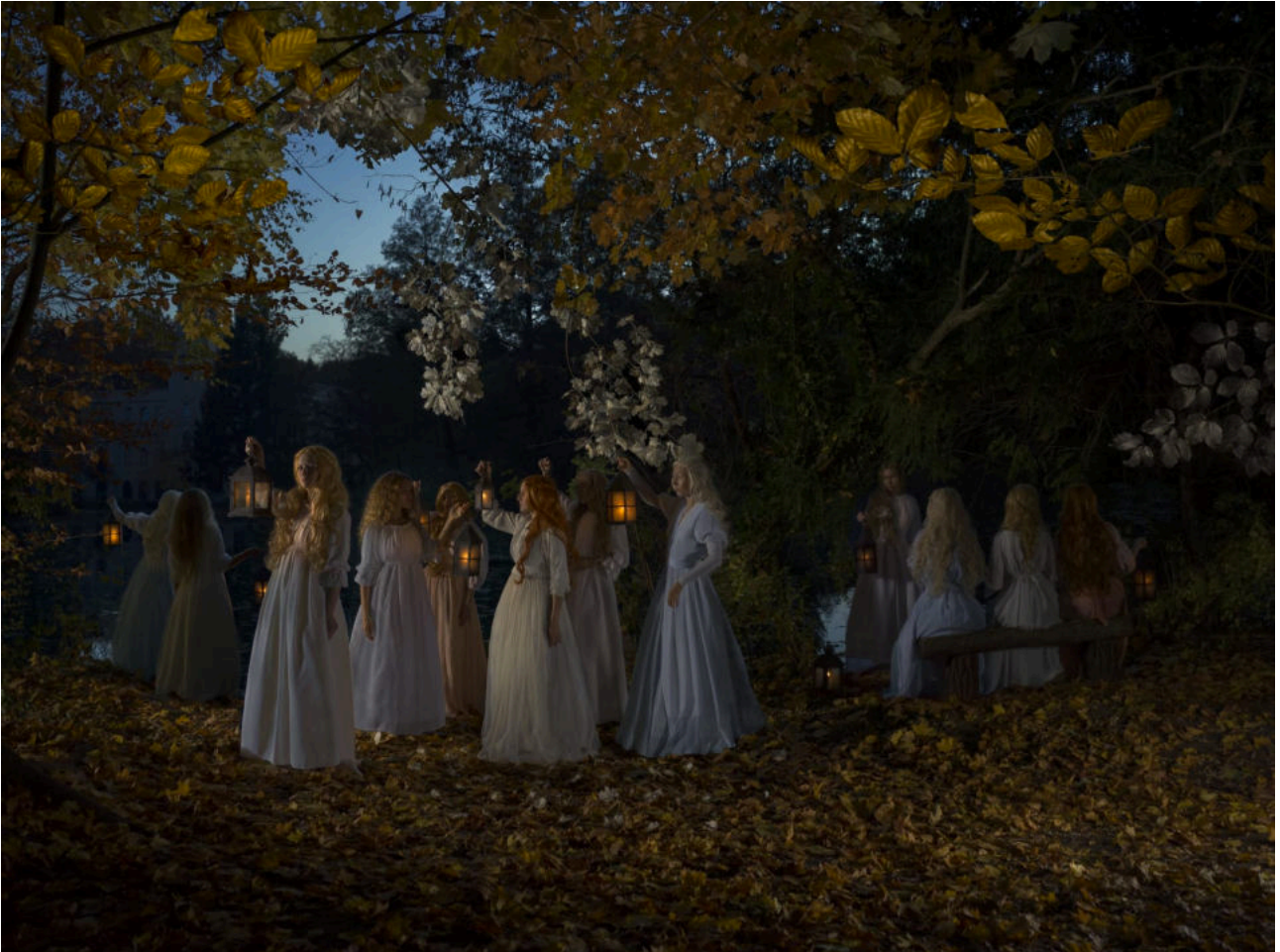
Katerina Belkina · Premonition · 2019 · Photography · 150 X 200 cm · Series Dream Walkers

Saison 2019/20 [20. April 2019 - 5. Januar 2020]