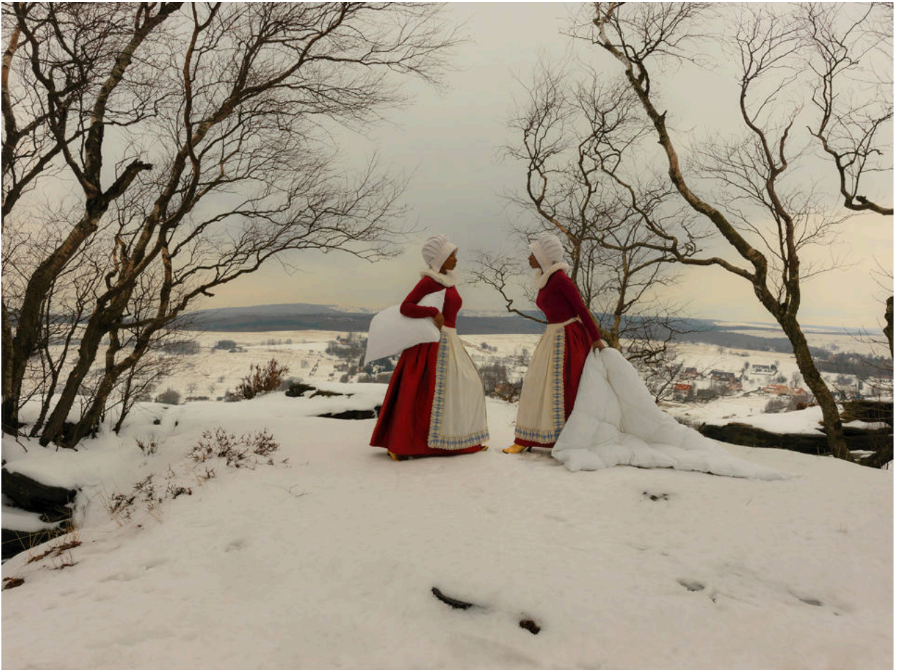
Katerina Belkina · The Whisper · 2019 · Photography · 150 X 200 cm · Series Dream Walkers

Grimm Fairy Tales Project 2017 - 2019 | Photography · Installations · Sculptures MainStage - 20. April bis 4. August 2019