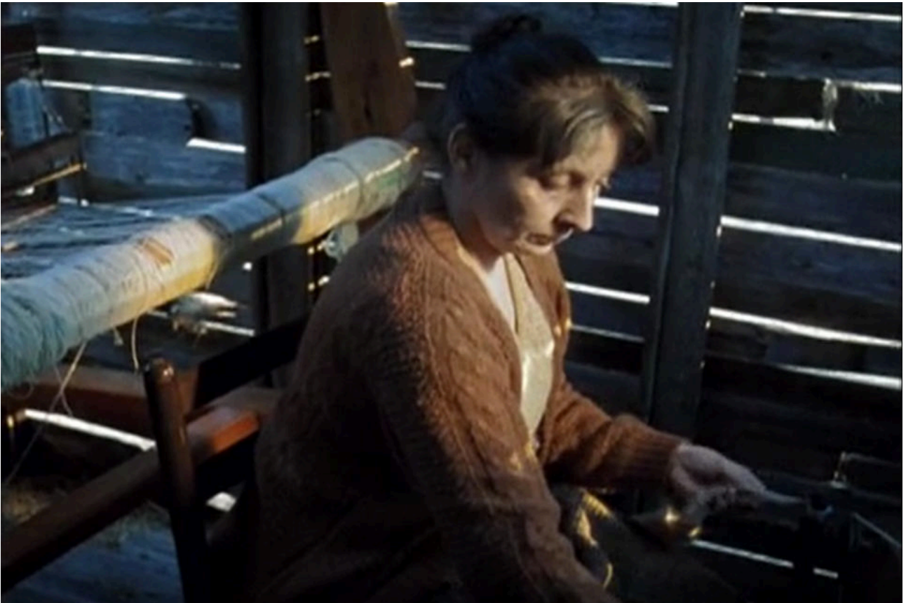
Iskra Valtcheva · IV Iris Moon Screen [film still]

Video | Screening Room - 20. April bis 4. August 2019