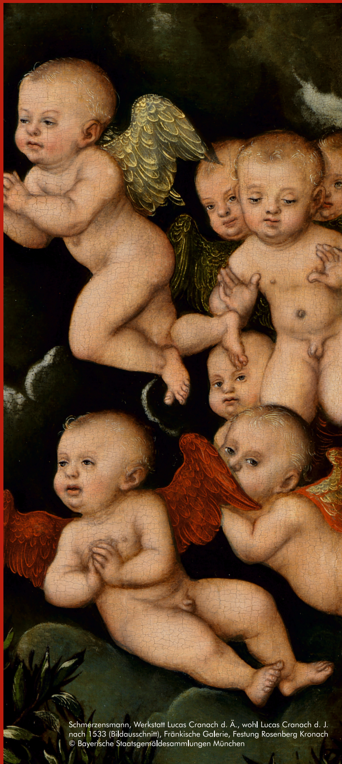
Schmerzensmann, Werkstatt Lucas Cranach d. Ä., wohl Lucas Cranach d. J. nach 1533 (Bildausschnitt), Fränkische Galerie, Festung Rosenberg Kronach