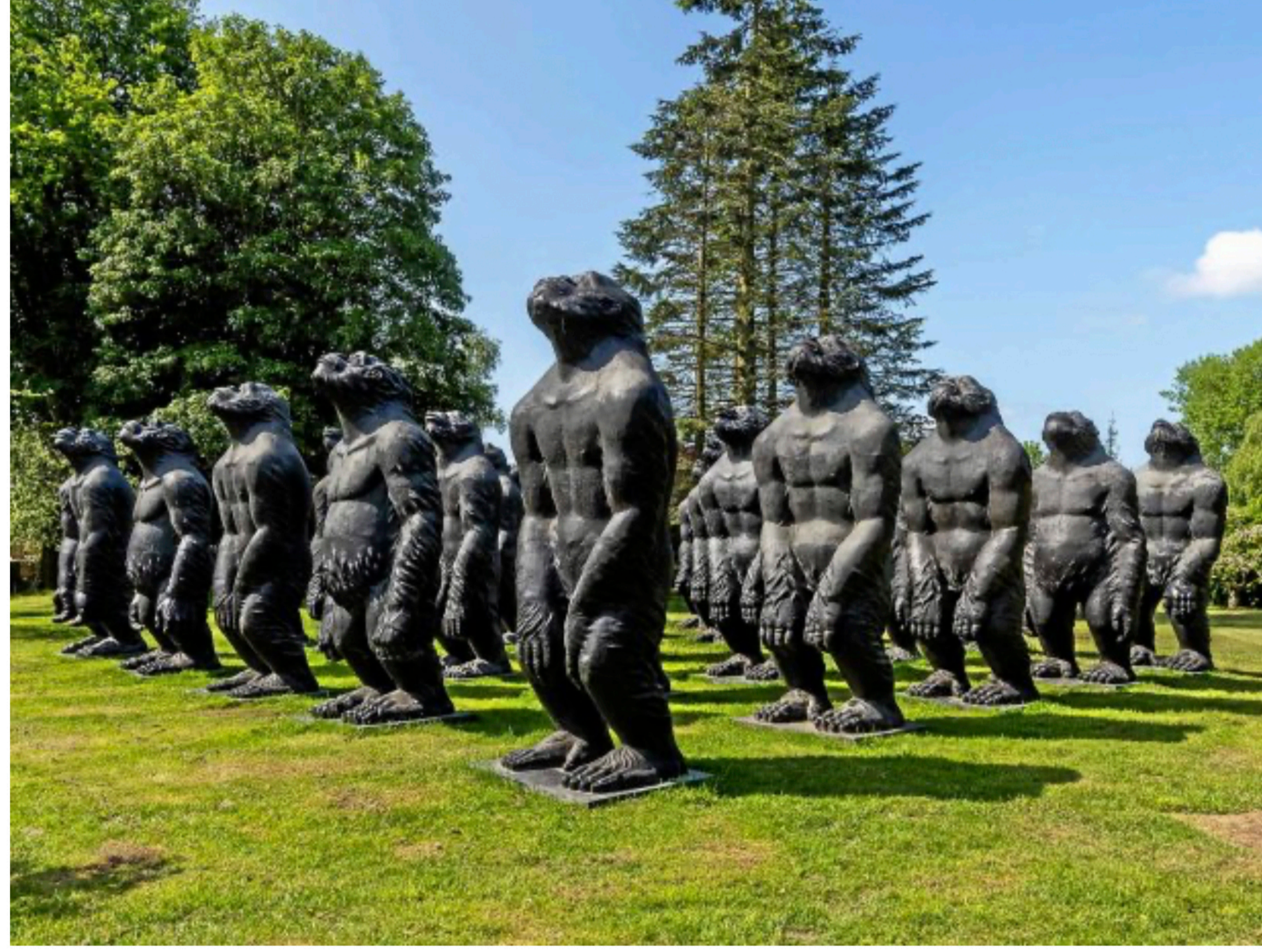
Liu Ruowangs Skulpturengruppe riesiger Menschenaffen „Original Sin“ ist zum Markenzeichen der NordArt geworden.

Auch, wenn sich das Konzept der NordArt seit Gründung kaum verändert hat, erleben Besucherinnen und Besucher die einmalige Atmosphäre immer wieder aufs Neue: Eine Weite im 22.000 Quadratmeter fassenden Skulpturenpark tut sich auf; hier spaziert man zwischen Werkgruppen, die inmitten von saftigen Wiesen, Bäumen, Bambusfeldern und Teichen angeordnet sind – und freut sich, „alte Bekannte“ wiederzusehen wie etwa eine Gruppe von überlebensgroßen Affen.